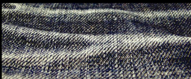
Col. : LIGHT