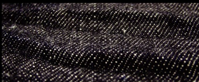
Col. : RINCE