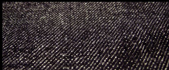
Col. : RIGID