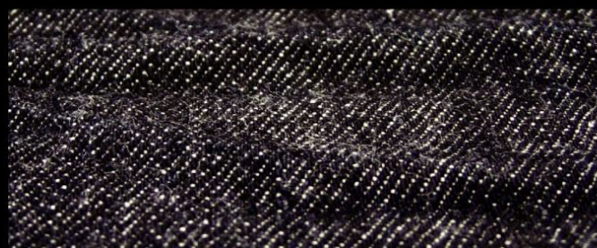
Col. : RINCE