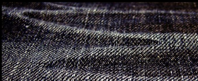
Col. : DARK