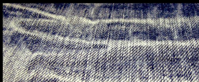
Col. : LIGHT