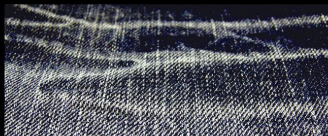
Col. : MID