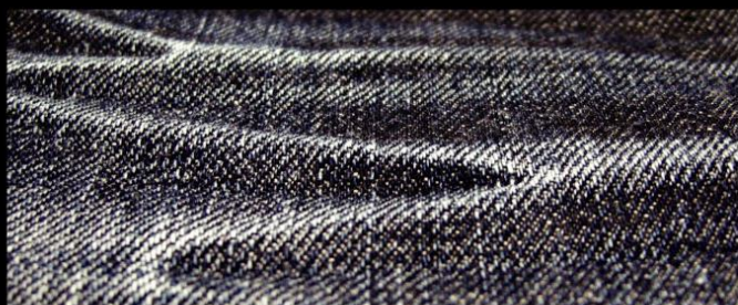
Col. : MID